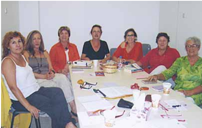
DONES PER LA IGUALTAT DEL MASNOU

L'associació Dones per la Igualtat del Masnou es trasllada properament al nou espai del Centre d'Informació i Recursos per a Dones de l'Ajuntament del Masnou (CIRD), a la Casa de Cultura. Des d'allà continuarem organitzant les activitats de l'associació i hi traslladarem el fons bibliogràfic relacionat amb els temes que tractem: igualtat entre dones i homes, històries de dones, dones a la història, dones i drets, i violència de gènere, entre d'altres.