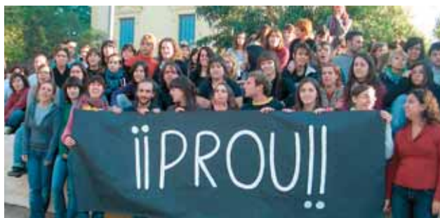
L'alumnat de 2n curs del cicle d'integració social de l'IES Maremar.

L'acte central de la campanya va ser el 25 de novembre i va consistir en la presentació a la ciutadania del Protocol municipal per a casos de violència de gènere , que, com ja us vam informar al primer número de la revista, va ser aprovat per unanimitat del Ple de l'Ajuntament el 17 de juliol de 2008. Aquest document recull els circuits específics d'intervenció que es posen en marxa davant de situacions de violència de gènere al municipi, els recursos