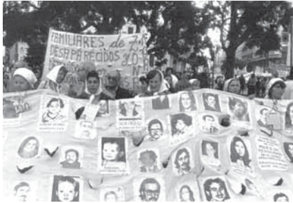
ABUELAS DE LA PLAZA DE MAYO

L'associació civil Abuelas de la Plaza de Mayo és una organització no governamental creada a l'octubre del 1977 que té com a finalitat localitzar tots els infants segrestats i desapareguts durant la repressió política argentina i restituir-los a les seves famílies legítimes, crear les condicions perquè mai més no es repeteixi una violació tan terrible dels drets