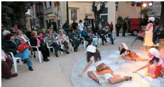
Un moment de l'espectacle 'Marina, la dona que somiava volar'.

El 8 de març, Dia Internacional de la Dona, s'ha convertit en un símbol per a les dones dels cinc continents. La celebració no es basa en un únic fet ni tampoc ha tingut sempre el mateix sentit. Una vegada aconseguida la igualtat legal, ara és moment de perseguir la igualtat efectiva entre dones i homes, i és per això que des de la Regidoria de Dona es van organitzar, durant tot el mes de març, un seguit d'actes dirigits al conjunt de la ciutadania amb la intenció de fer visibles els rols que continuen assignant-se a ambdós sexes, els estereotips de gènere que caracteritzen i defineixen