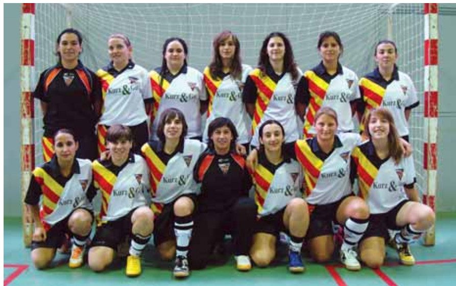
ASSOCIACIÓ ESPORTIVA FUTBOL SALA MASNOU