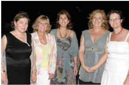
DONES D'AVUI EL MASNOU

L'associació Dones d'Avui El Masnou és una entitat activa, amb voluntat de créixer per fer que la igualtat d'oportunitats, de drets i de tracte sigui una realitat efectiva.