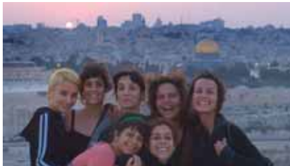
Article realitzat pel grup de dones Les Nazarlona l listes-nazarlona@sci-cat.org

Per parlar de les dones palestines és inevitable referir-se al conflicte de l'Orient Mitjà, fet que requereix temps per tal d'entendre la diversitat de factors que intervenen a perpetuar la situació sociopolítica que es dóna en aquesta part del món. Tenint en compte que es tracta d'un conflicte molt mediatitzat i àmpliament documentat, en aquest article provarem d'explicar una perspectiva que sovint queda silenciada: la situació i el posicionament de les dones palestines en la lluita contra l'ocupació israeliana.