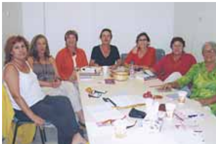
DONES PER LA IGUALTAT DEL MASNOU

L'associació Dones per la Igualtat del Masnou és una entitat sense ànim de lucre que treballa per la igualtat d'oportunitats entre dones i homes, i pertany a la Federació de Dones de Catalunya per la Igualtat.